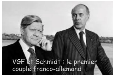
VGE et Schmidt : le premier couple franco-allemand

L'expression caractéristique du « couple franco-allemand » remonte aux années 1970. Elle renvoyait initialement à l'étroite collaboration entre Valéry Giscard d'Estaing et Helmut Schmidt. Au cœur de celle-ci, se trouve l'approfondissement de la construction européenne. En 1975, est ainsi créé le Fonds européen de développement régional (FEDER), qui permet davantage de solidarité entre les pays européens et favorise l'intégration de nouveaux États membres, comme la Grèce en 1981. En 1978, les deux dirigeants lancent le projet de Système monétaire européen (qui remplace le Serpent monétaire européen) afin de renforcer un peu plus la stabilité des monnaies européennes qui furent affaiblies.