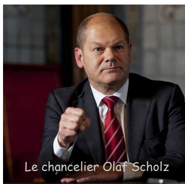
Le chancelier Olaf Scholz

Appelé Next Generation EU, ce plan a une double finalité : réparer les dommages économiques et sociaux causés par la pandémie et conduire vers une Europe plus verte, plus numérique, plus résiliente et mieux adaptée aux défis actuels et à venir.