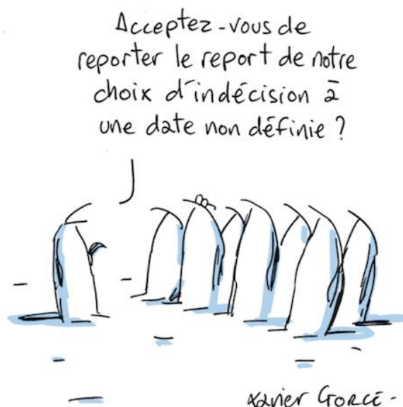
Brexituc (Xavier Gorce) Le Monde du 11 avril, rubrique Les indégivrables