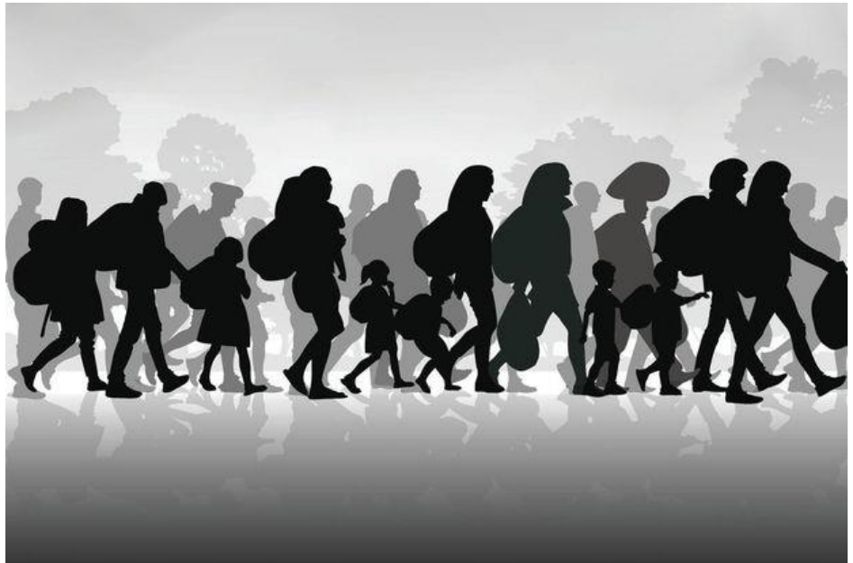
Silhouettes de migrants

Le Pacte porte aussi la marque des circonstances qui ont entouré son élaboration : en particulier la crise migratoire qu'a affrontée l'Europe en 2015 et qui a vu l'arrivée de plus d'un million de personnes, en majorité syriennes, qui fuyaient les drames du Proche Orient, l'hostilité des populations de l'Est de l'Union, les plus directement concernées, les divergences gouvernementales sur l'accueil de ces immigrés, et la difficulté des Institutions européennes à imposer leur répartition. Face au désarroi des opinions partagées entre les craintes populaires et l'indignation des milieux humanitaires, il paraissait opportun de rappeler leurs devoirs moraux aux Etats et de suggérer que les migrations pouvaient avoir un aspect positif si elles étaient gérées en commun, tout en affirmant, pour les rassurer, le caractère « non juridiquement contraignant » des engagements qu'on leur demandait de prendre.