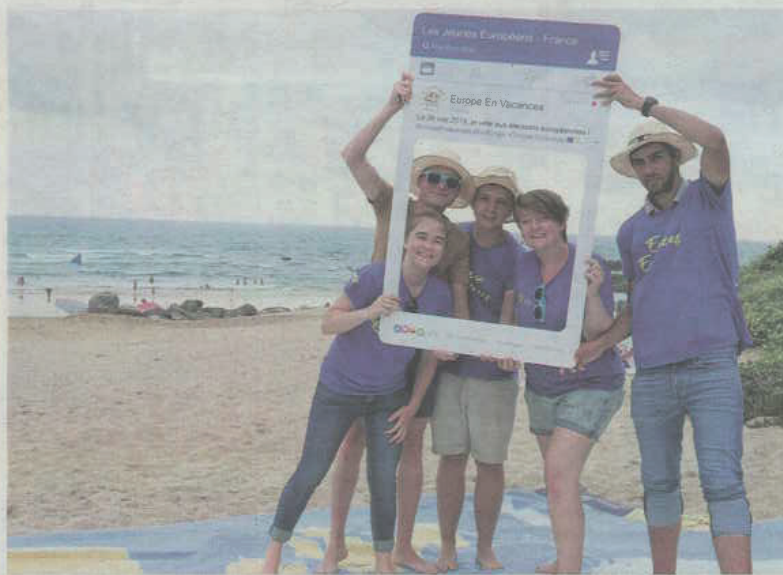
La caravane des Jeunes Européens fait son terminus aujourd'hui à Hendaye