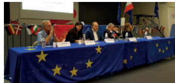
Grand Oral de Toulouse (septembre 2017) avec les députés José Bové (Les Verts), Virginie Rozière (Socialistes & Démocrates) et Joëlle Mélin (Europe des Nations et Libertés)

En 2017, 4 éditions des Grands Oraux ont été organisées au Mans, à Toulouse, à Reims et à Neuilly-sur-Seine avec la participation de 17 élus européens représentant tous les partis.