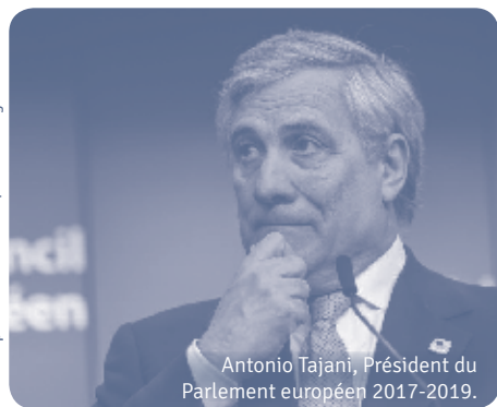
Antonio Tajani, Président du Parlement européen 2017-2019.

En plus d'être un lieu crucial de décision , le Parlement européen est aussi un espace de dialogue entre les citoyens et les institutions européennes . Seule institution européenne dont les membres sont élus au suffrage universel direct, le Parlement européen place le citoyen au centre de l'action européenne. Le droit de vote, le droit de pétition ou encore l'initiative citoyenne européenne (ICE) constituent des acquis fondamentaux et influencent l'action de l'UE dans son ensemble.