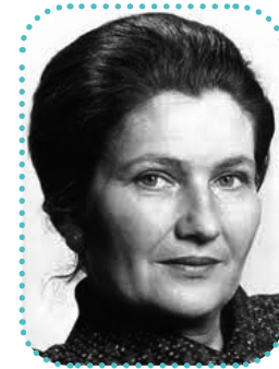
Simone VEIL, première Présidente du Parlement euro- péen (1979-1982)